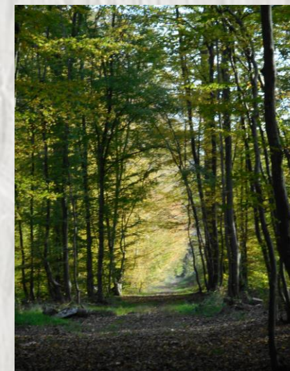
Forêt domaniale de Jouy : Allée du Beau Chêne

Cette randonnée agréable aux paysages typiquement briards tourne autour de Villars, un hameau de Saint-Hilliers, commune de départ. Elle traverse plusieurs autres jolis hameaux de Saint-Hilliers aux fermes remarquables. La petite incursion en forêt de Jouy vous permettra de profiter de l'aire de pique-nique du Beau Chêne pour une petite pause.