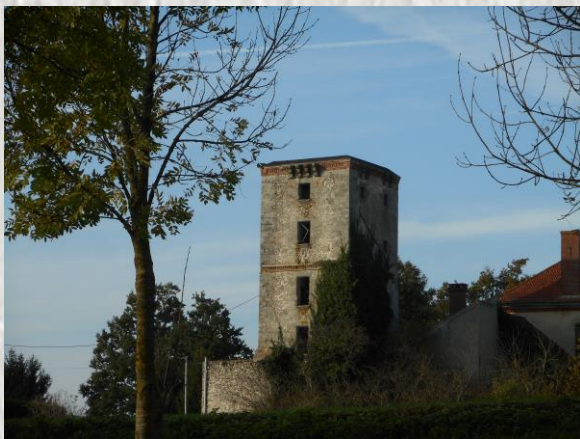
Donjon de l'ancien château de Quincy – Photo S et JM P ©

Du château, il ne reste rien, seul le donjon subsiste. Une belle ferme anime ce hameau.