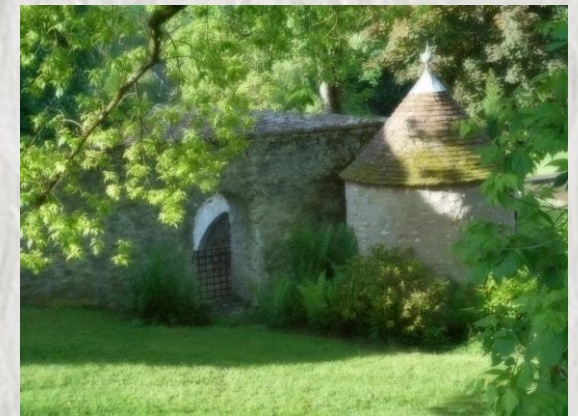
Vestige de la Léproserie de Sainte-Colombe