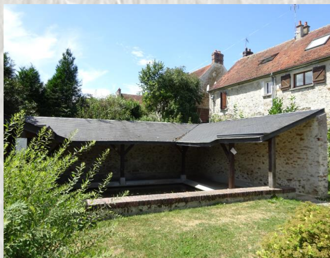
Lavoir de Marolles-en Brie