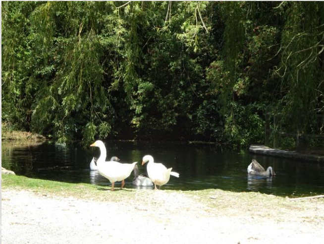
La Cressonnière