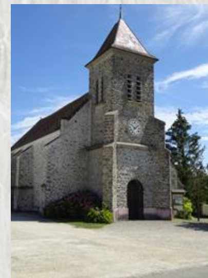
L'Église de Marolles-en-Brie

Cette courte randonnée vous montrera en quelques kilomètres les principaux paysages de la Brie Laitière : un vallon, celui du Vannetin, un charmant village, Marolles-en-Brie avec son église, son lavoir, son ancien château et sa ferme et pour être complet un peu de plateau.