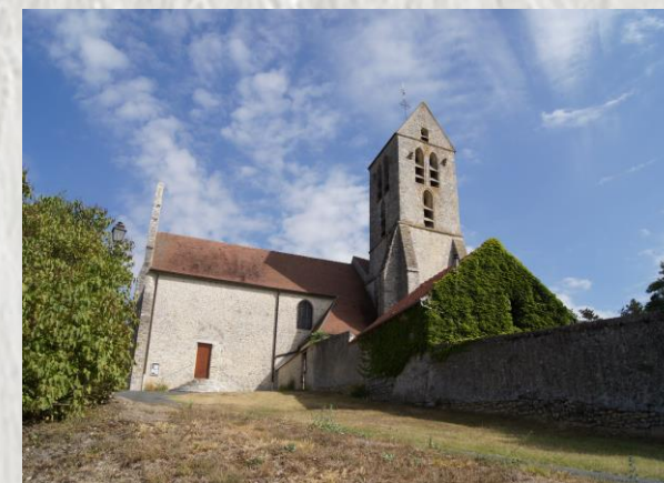
L'Église de Nanteau-sur-Éssonne

Au sud du Gâtinais français, l'itinéraire longe les marais de l'Éssonne et sillonne les canches, ces étroites allées sèches où arbres et forêt alternent avec sable et rochers.