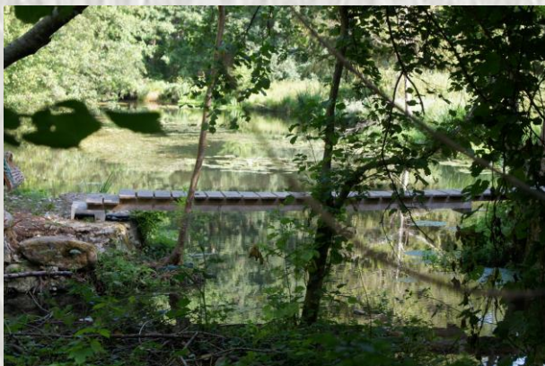
Marais de Brigneville sur l'Éssonne

Cette belle fleur jaune se laisse facilement apercevoir dans les zones humides. Ses habitats de prédilection sont les marais, les prairies marécageuses, les bois humides, les bords de ruisseau, les fossés, etc. On l'appelle aussi souci d'eau. Ses grandes feuilles arrondies en cœur s'étalent sur la surface de l'eau, laissant apparaître une tige épaisse, lisse et luisante. D'avril à mai, cette tige se termine par une fleur composée de cinq sépales jaunes d'or, sans pétales, pouvant atteindre cinq centimètres de diamètre. Cette plante vivace est de plus mellifère. Mais il ne faut pas s'y fier : sous ses allures de fleur de soleil se cache une plante envahissante ...et vénéneuse ! C'est peut-être ce qui lui vaut son autre surnom de « chaudière d'enfer ».