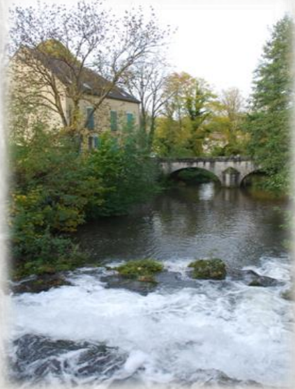
L'Orvanne à Écuelles

Informations pratiques : Tous commerces, pharmacie