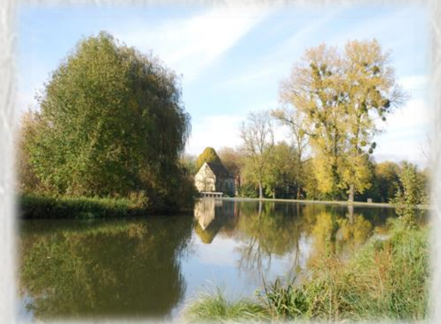
Étang de Ravannes à Écuelles

Villecerf et son église XIIème, Montarlot et sa curieuse église dont le clocher s'élève en son centre, Écuelles et les restes du château de Ravannes, s'échelonnent le long du parcours. L'étang de Moret et l'ancienne demeure des Carnot, ne sont visible que de loin.