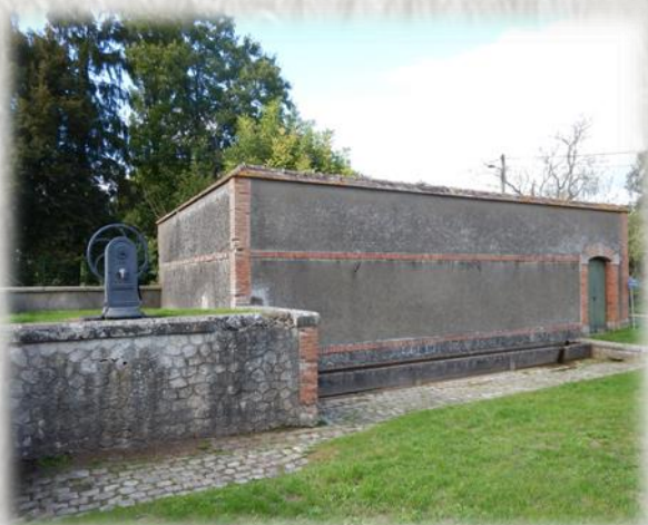
Des sources pour Paris

L'alimentation en eau de Paris se fait pour moitié par des eaux de sources captées loin de la capitale, en particulier en Seine-et-Marne. Ainsi, dans la basse vallée du Lunain, les sources de Villemer et de Villeron déversent leur eau dans un aqueduc qui les transporte jusqu'à l'usine de traitement de Sorques, à Montigny sur Loing. De là, elles sont renvoyées dans l'aqueduc du Loing qui va suivre celui de la Vanne jusqu'à Paris. Les eaux captées pouvant subir l'influence de toutes sortes d'activités humaines, de vastes périmètres de protection ont été instaurés dans la vallée, afin de réduire les risques de dégradation des sources.