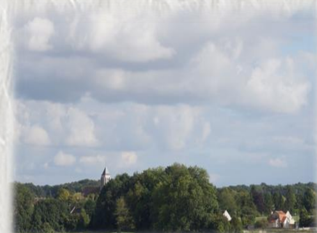
En basse vallée du Lunain

Un parcours à la découverte du Lunain, affluent du Loing, du plateau agricole et de sites d'anciennes industries.