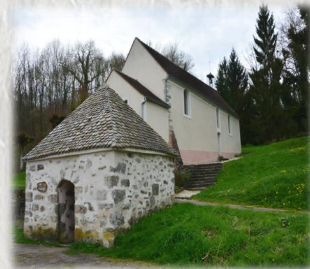
St-Augustin, source de Ste-Aubierge

Au cœur de la vallée de l'Aubetin, découvrez l'ancienne demeure du Seigneur Gueric, le moulin où vécut Vercors et la petite chapelle Sainte-Aubierge.