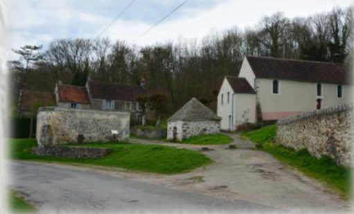
St-Augustin, site de Ste-Aubierge

C'est au XII ème siècle qu'Aubierge, fille d'un roi d'Est-Anglie se retire avec sa sœur Sédride en l'abbaye de Faremoutiers, fondée par sainte Fare, dont elle deviendra plus tard abbesse. La première chapelle fut construite au XII ème siècle, c'est un petit oratoire au bord de l'Aubetin. Elle fut entièrement reconstruite en 1714 sur l'ordre de madame de Beringhen, 44 ème abbesse. La source, au pied de la chapelle, fut d'abord un lieu de dévotion païenne probablement liées à des rites gallo-romains. Elle est christianisée lors de l'évangélisation de la région sous l'influence des moniales de Faremoutiers. En 1712, des anglais, en pension à l'abbaye, la couvrent d'un édicule en pierre. La source était réputée dans toute la Brie pour ses vertus miraculeuses. La pureté et la fraîcheur de son eau ont motivé la tradition populaire préconisant « celle qui boit à cette source se mariera dans l'année ».