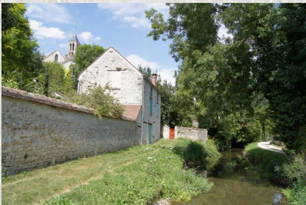
Château-Landon : Le Fusain

Tout au sud de la Seine-et-Marne, Château-Landon veille sur les vallées du Loing et de son affluent, le Fusain. Muraille, tours, église et abbaye, toutes faites de la pierre blanche extraite sur place, marquent l'emplacement d'un ancien oppidum que César mit trois jours à conquérir. Cinq siècles plus tard, alors que le roi Clovis est atteint d'une forte fièvre, il fait appel à Séverin, moine réputé pour son pouvoir de guérison, qui vient du Valais à Lutèce. Couvrant le roi de son manteau, il le guérit. Sur le chemin du retour, Séverin s'arrête ici et sait qu'il n'ira pas plus loin. Ses reliques feront rapidement la renommée de Château-Landon dont l'influence ne cessera de grandir, la ville allant jusqu'à devenir capitale du Gâtinais.