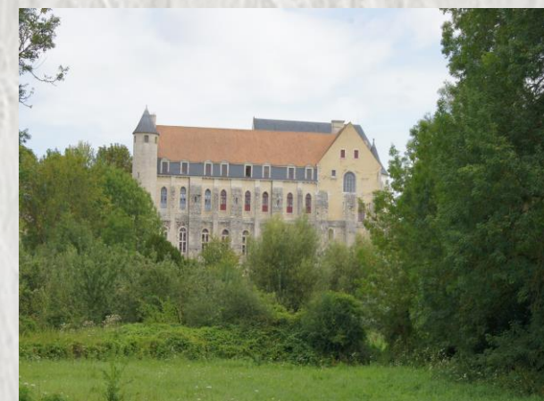
Château-Landon : ancienne Abbaye – Photo CP ©

De gare en gare : Souppes-sur-Loing / Dordives