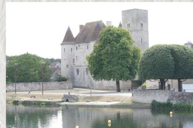
Château de Nemours

Visitez Nemours, ancienne capitale du Gâtinais et son château qui domine les rives du Loing, parcourez la forêt parsemée de chaos rocheux cernés de landes sablonneuses puis rejoignez Souppes-sur-Loing, célèbre pour sa pierre calcaire.