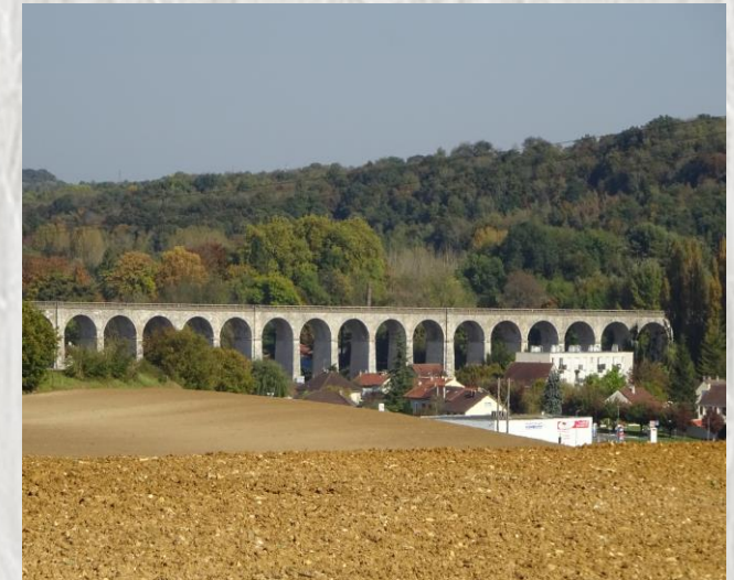
Viaduc de Longueville – Photo CD ©

Étape 1 : Le Montois (Longueville / Donnemarie-Dontilly)