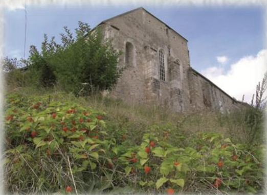
Montereau : Le Prieuré Saint Martin

Des fouilles sont entreprises et mettent à jour dans l'ancienne chapelle des vestiges des XI e et XIII e siècles en particulier des sarcophages dont certains réemplois sont visibles dans les contreforts. Le Prieuré est en plein cœur de la Réserve naturelle de la Colline St-Martin et des Rougeaux. Ce site présente une grande richesse floristique, offre un intérêt paysager et une diversité biologique peu commune qui, ajouté à son intérêt historique, mérite d'être parcouru.