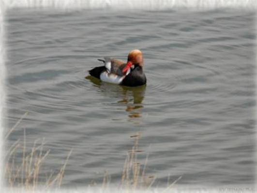
Nette rousse - Réserve ornithologique du Carreau Franc - Marolles-sur-Seine - Photo ANVL - T.Jourdain ©

Désormais réserve ornithologique, le Carreau Franc possède un observatoire d'où vous pourrez contempler un grand nombre d'oiseaux tels que des courlis, bécasseaux, grands cormorans, canards souchets, pilets, sarcelles, colvert... auxquels s'ajoutent quelques raretés comme la cigogne blanche ou l'aigrette garzette. Ces espèces stationnent quelques heures ou parfois quelques jours avant de reprendre leur vol migratoire.