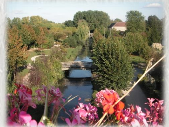
Marolles sur Seine : Jardin des Iles

Entre paysage aquatique du Val de Seine et les premiers vallons du Montois, découvrez un territoire rural au patrimoine architectural et agricole varié.