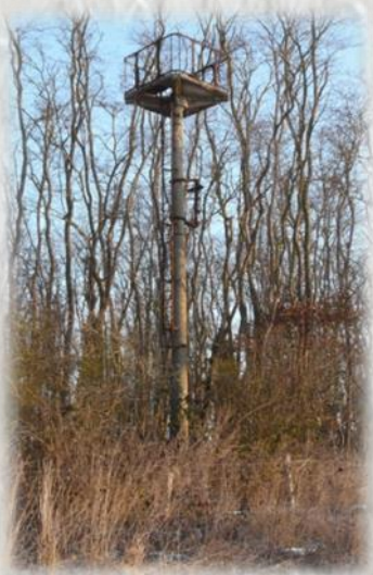
Saint Germain Laval : Phare aéronautique

De ce hameau subsistent quelques curiosités comme un four banal qui autrefois, appartenait au Seigneur et permettait aux paysans de cuire leur pain moyennant une redevance, et un phare aéronautique installé par le Ministère de l'Air. Jusqu'au début de la Seconde Guerre mondiale, il facilitait la navigation des aéronefs la nuit et par mauvaise visibilité.