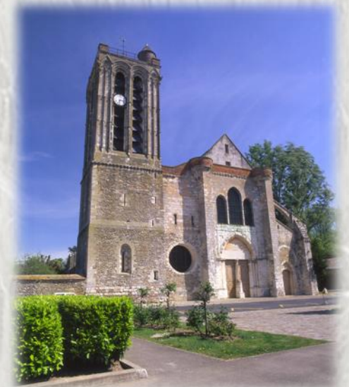
Collégiale Saint Martin de Champeaux – Photo : SMT ©

Le val d'Ancoeur est riche en édifices historiques, les plus réputés étant le château de Vaux-le-Vicomte et la collégiale de Champeaux. Ce circuit permet de voir le château fort de Blandy-les-Tours, le château de Bombon et Champeaux.